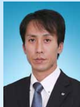
社団法人札幌青年会議所 第62代理事長

是非、皆様の企業経営にお役立ていただければ幸いです。 多くの皆様のご来場を心よりお待ちしております。