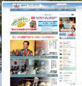
札幌JCIホームページ

本事業について詳しく知りたい方、 内容についてもっと知りたい方は 札幌JCIホームページをぜひご覧ください！