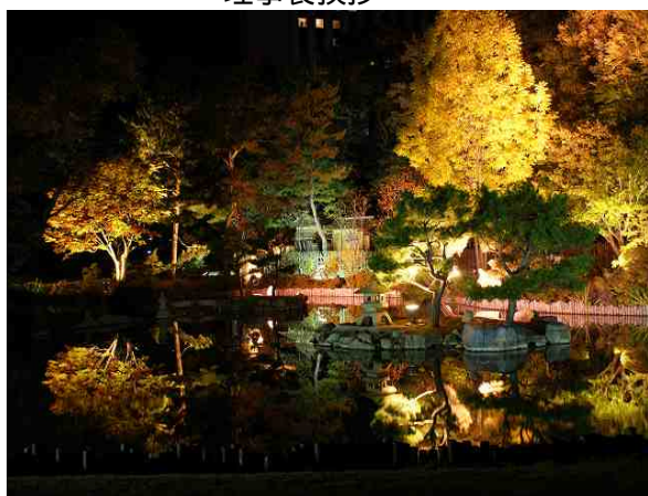
ライトアップ風景