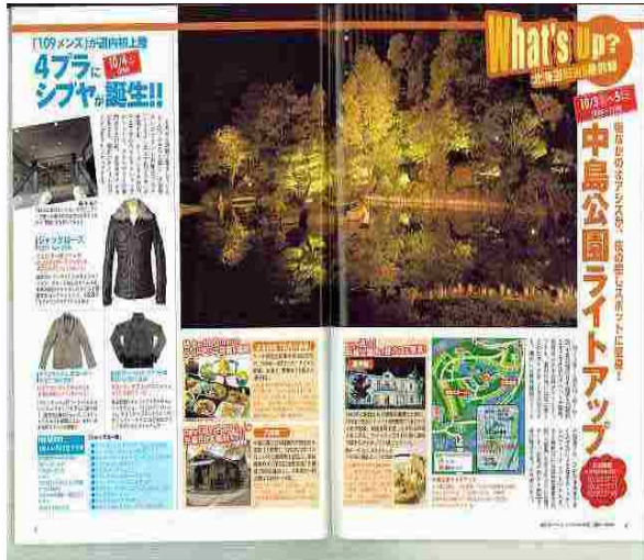
北海道ウォーカー