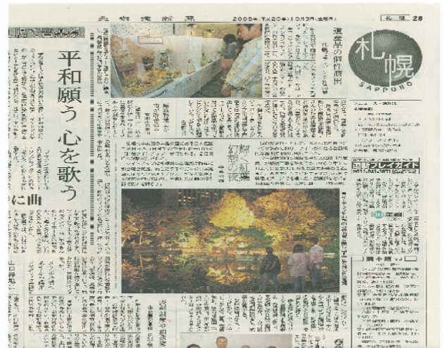
北海道新聞(10月3日朝刊)