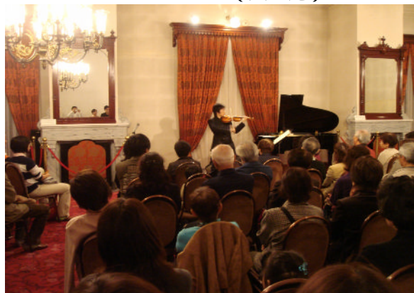
豊平館コンサート